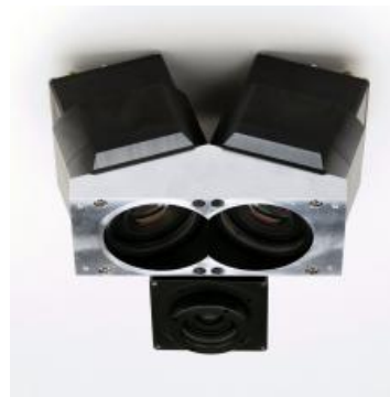
Elektronikkonzept für Luftbildkamera